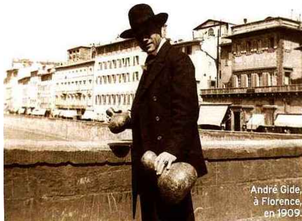
André Gide, à Florence, en 1909.

D e 1888, à 19 ans, son premier séjour en Angleterre à son adieu à l'Italie, en 1950, un an avant sa mort, André Gide n'a cessé de voyager en Europe, en Afrique du Nord, et bien sûr au Congo et en URSS, d'où il rapportera deux essais à scandale. Ce livre d'« archéologie littéraire » suit l'écrivain à la trace, cliché après cliché. Ici, en 1909, Gide pose sur le Ponte Vecchio, dans la « Belle Florence ». ● E. H.