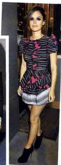
Chaussures « Eastwood », Brian Atwood, 1183 €. Disponibles sur www.net-a-porter.com