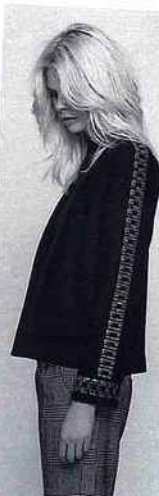
Pull: 92 €. Robe: 130 €. Manteau: 200 €. Tél.: 01 40 28 46 08.